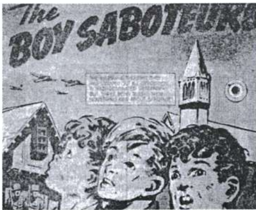
Tegneserie fra det amerikanske børneblad "Red Goose" 1944, bygget over Churchillklubbens bedrifter.

DRENGE-SABOTØRERNE. Tyskerne troede, de havde slået al Modstand i Danmark ned - men tre Drenge lærte dem noget helt nyt om Sabotage.